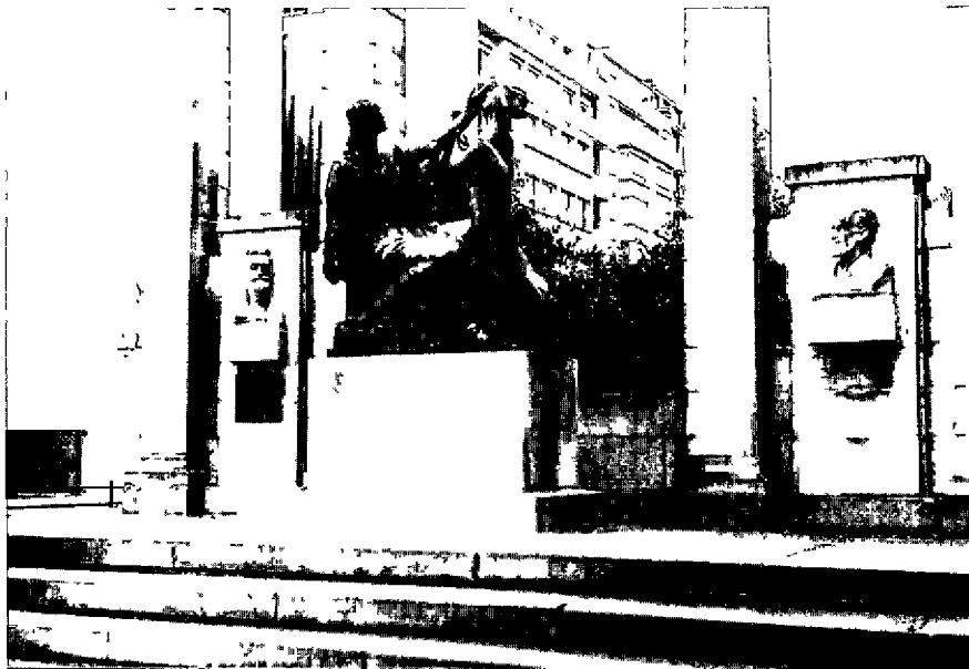
Het dubbelmonument De Mot (links) - Buls (rechts) aan het einde van de Louisalaan.

De dag na zijn overlijden kwam de gemeenteraad samen om kennis te nemen van het overlijden van hun burgemeester. De raad besloot in geheime zitting om de Natiënlaan (tussen de Louisalaan en de Ter Kamerenlaan) te herdopen tot de Emile De Motlaan.