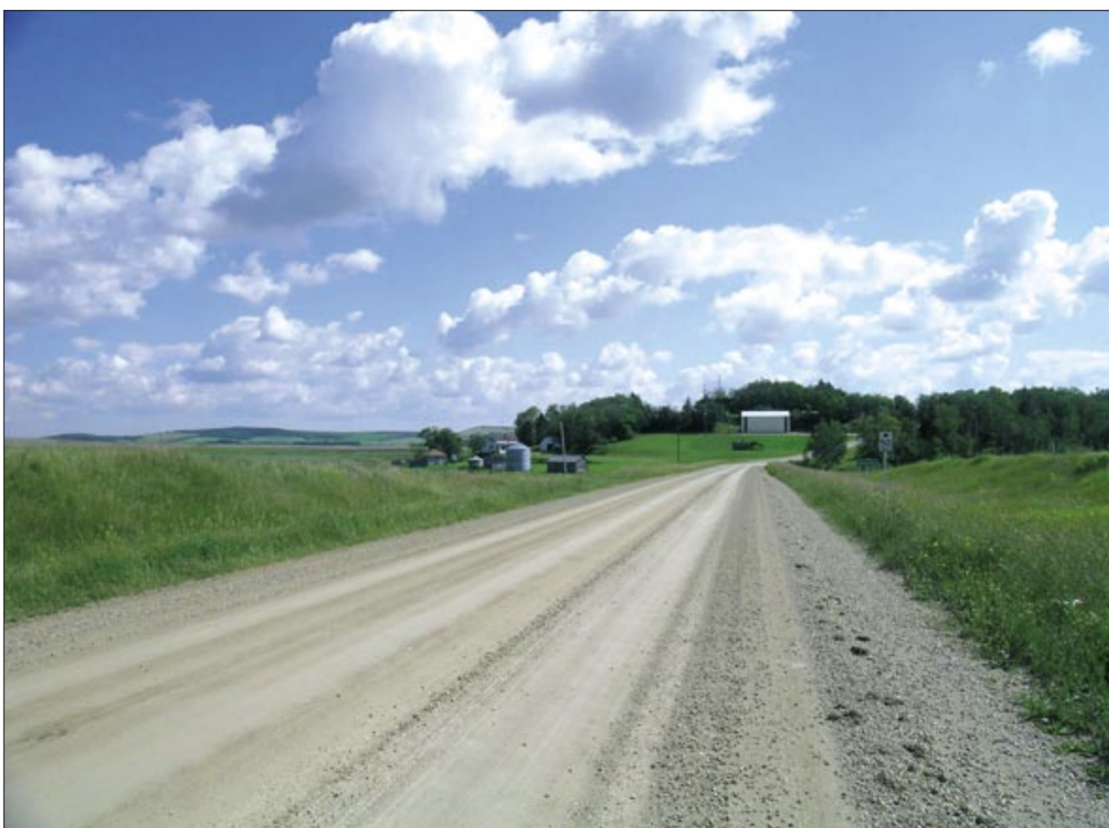
"Ja, ik ben fier op mijn Belgische afkomst. Kijk maar naar mijn sleutelhanger: een tricolor exemplaar."

Ook andere 'nieuwe Canadezen' konden de Belgische sfeer met schuim overigens wel smaken, zodat de Belgian Club een florissante vereniging werd, die ook een sociale voortrekkersrol opnam en mee het (katholiek getinte) welzijnswerk financierde. De Kerk (en haar Belgische pastoors) stampte in de pioniersjaren overigens flink wat structuren uit de grond waar Belgische